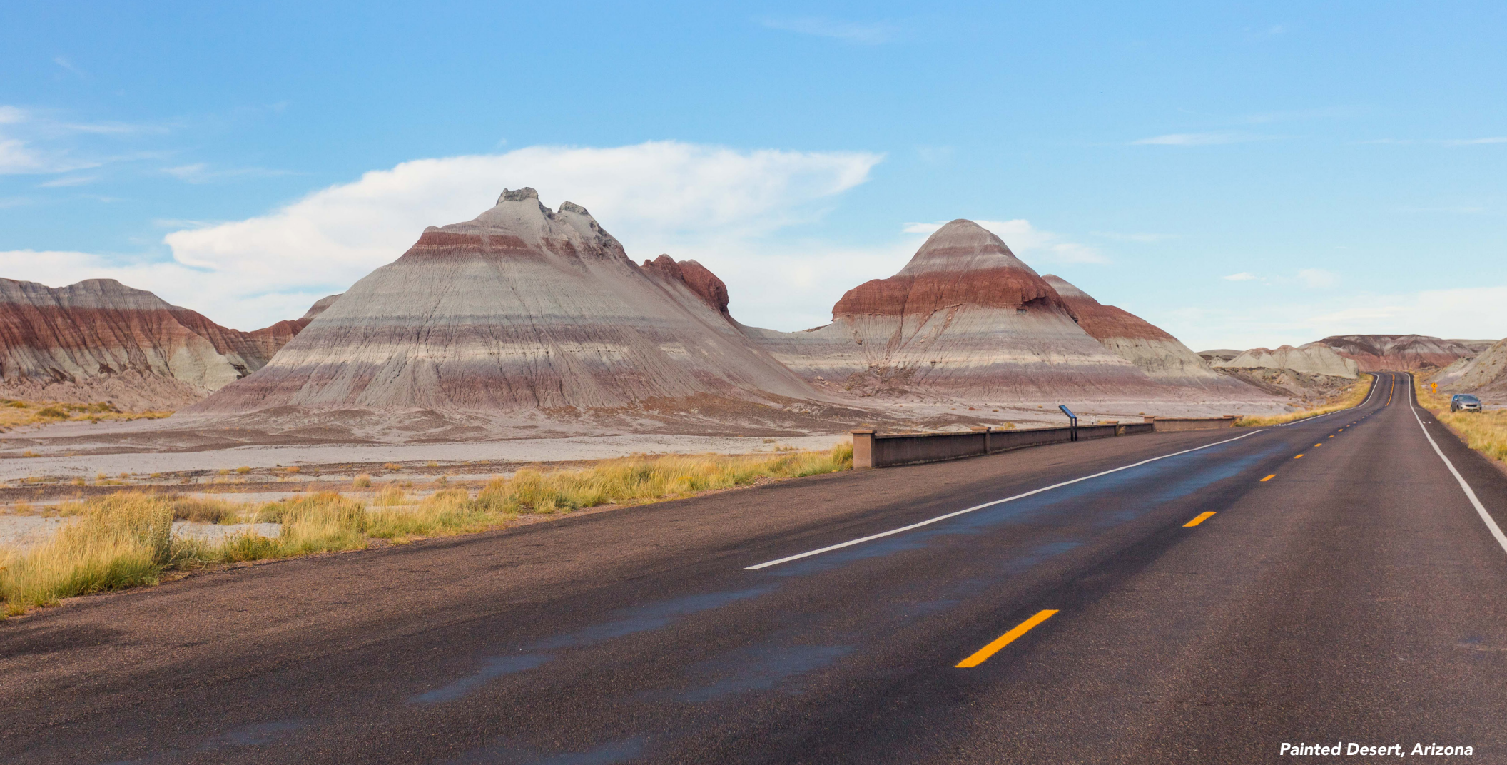
Painted Desert, Arizona