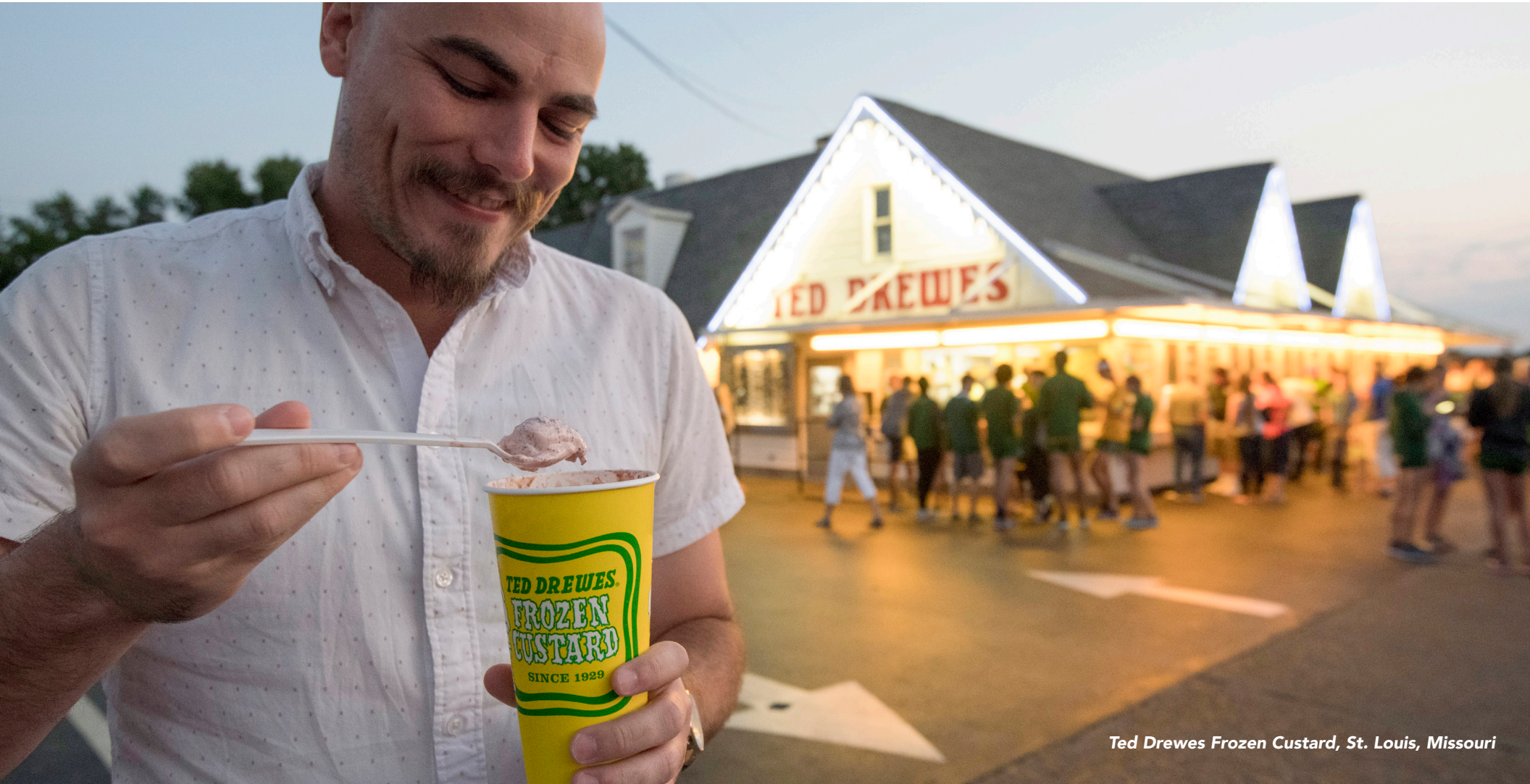
Ted Drewes Frozen Custard, St. Louis, Missouri