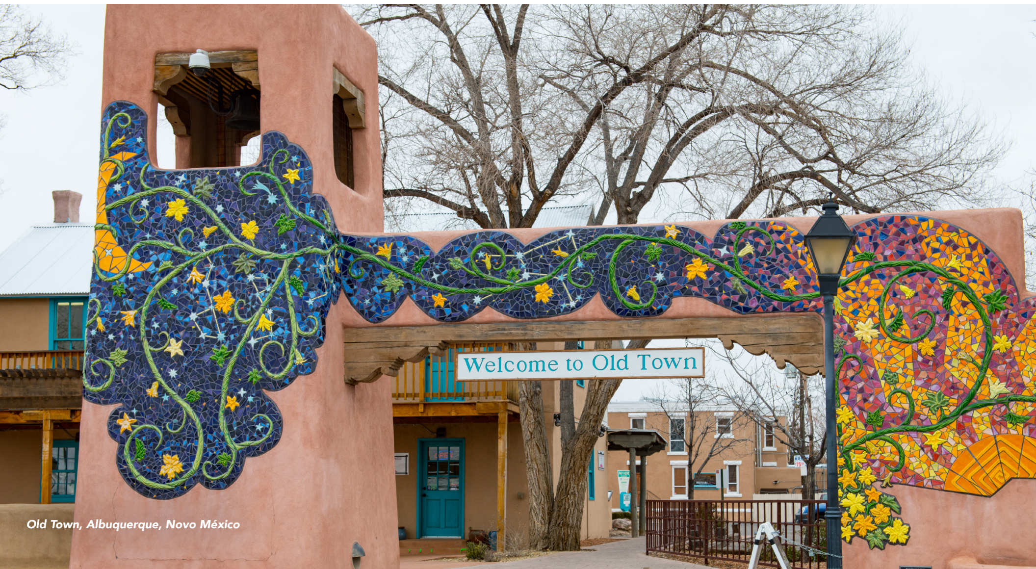
Old Town, Albuquerque, Novo México