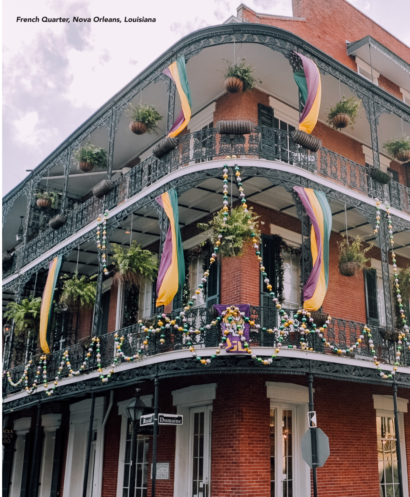
French Quarter, Nova Orleans, Louisiana