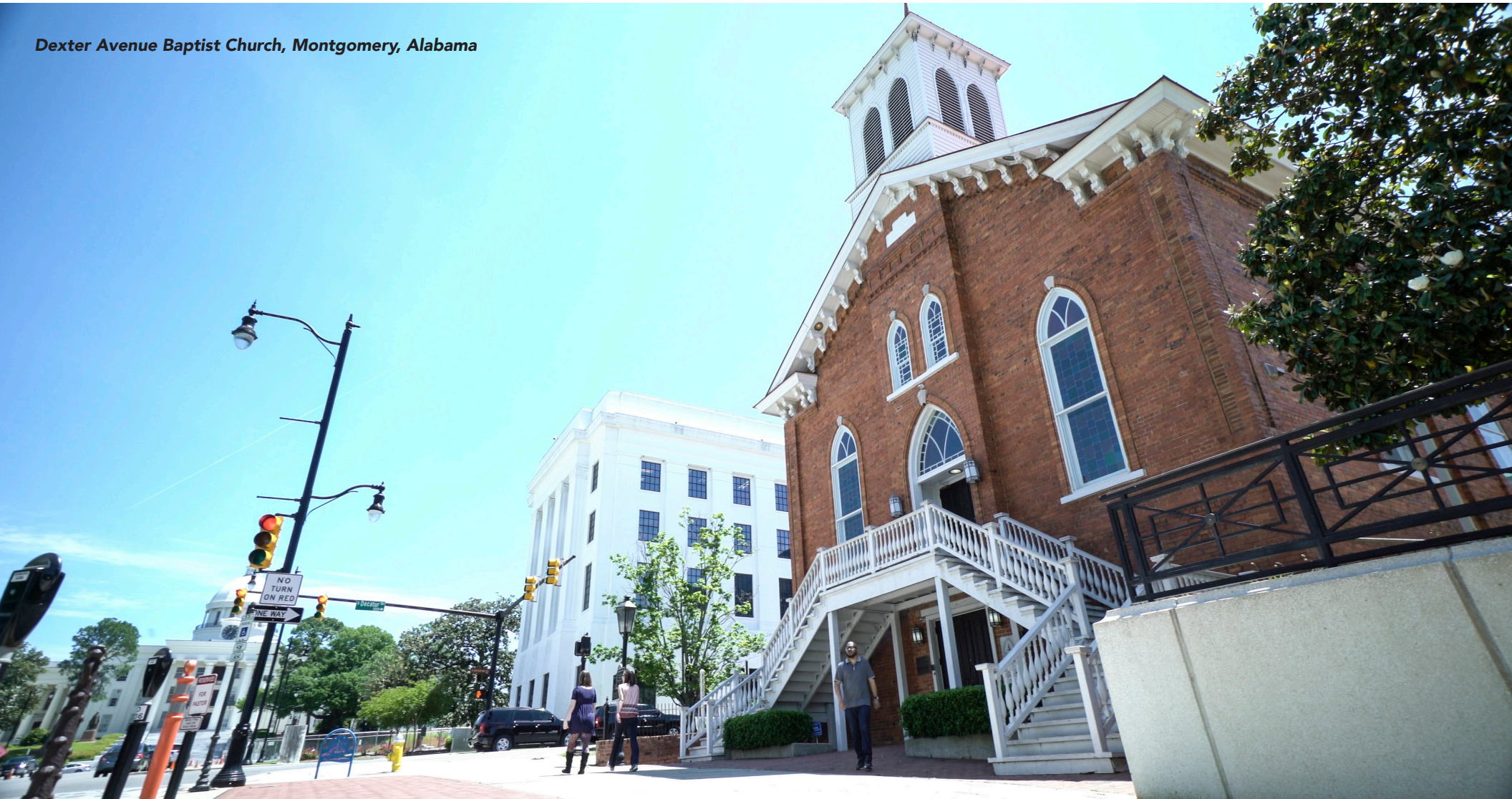
Dexter Avenue Baptist Church, Montgomery, Alabama