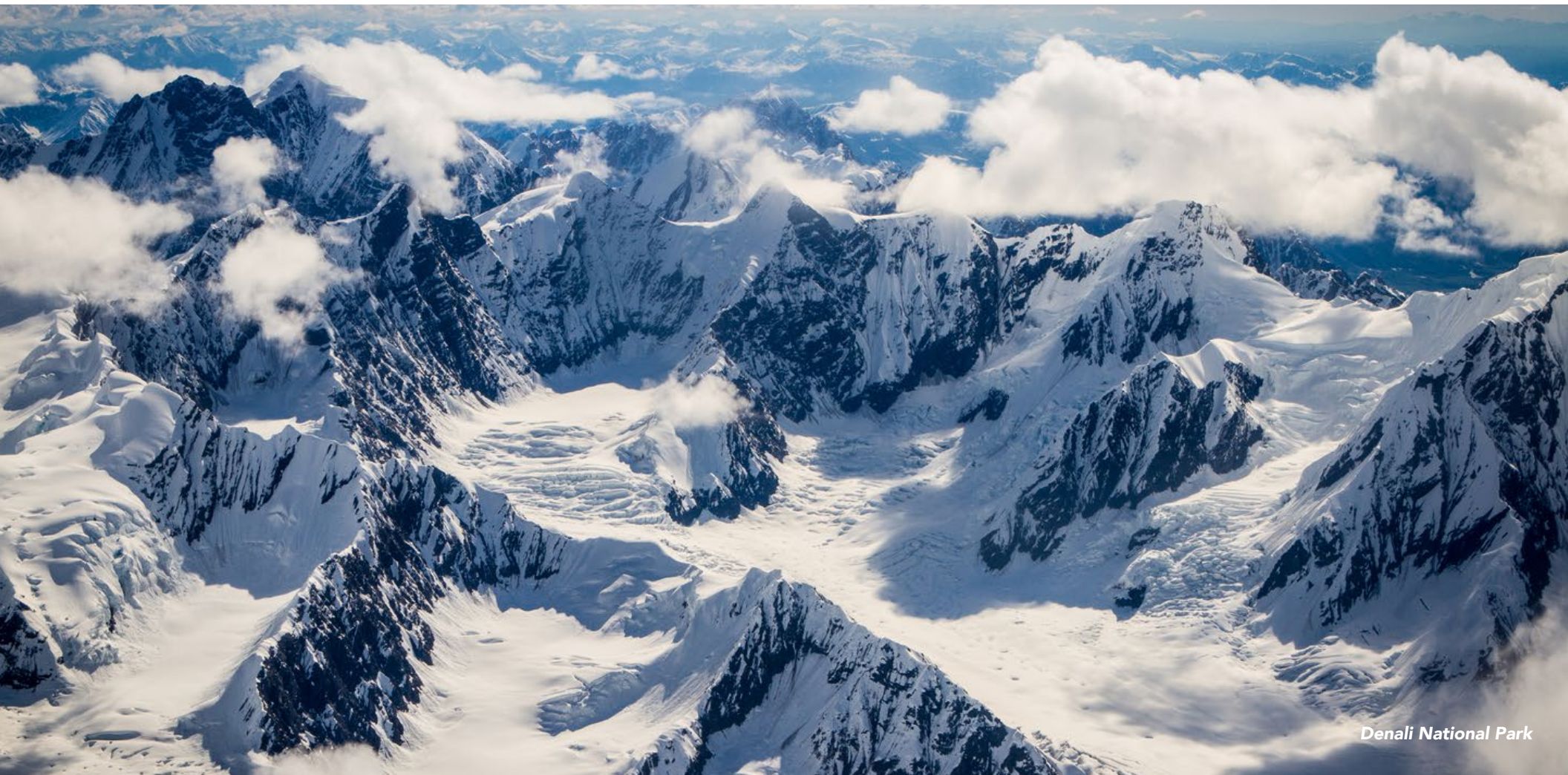
Denali National Park

Para buscar mais inspiração e ideias para viagens pelos EUA, acesse VisiteOsUSA.com.br