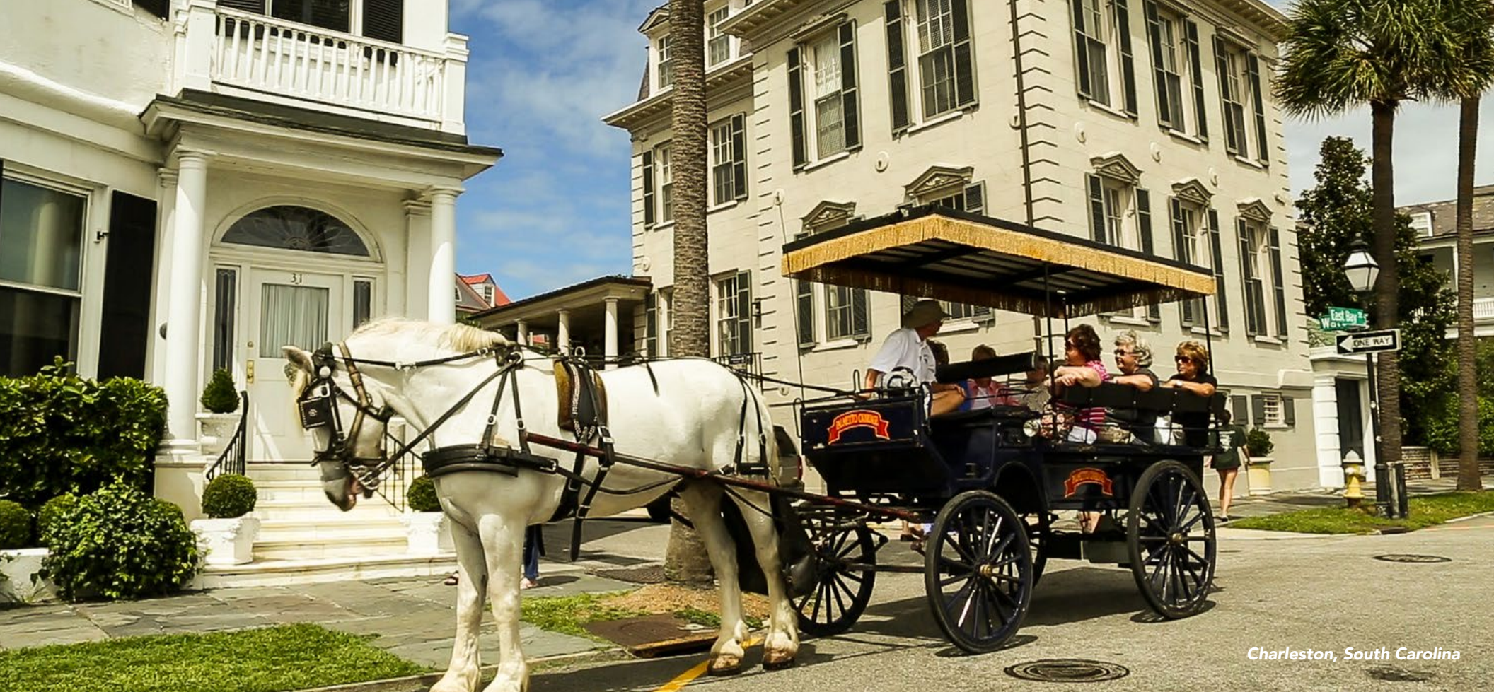
Charleston, South Carolina