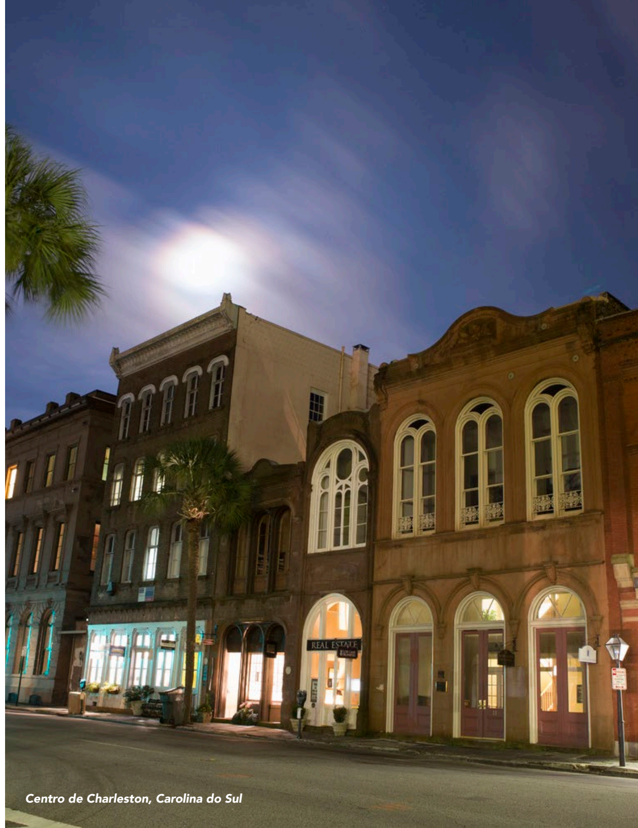
Centro de Charleston, Carolina do Sul