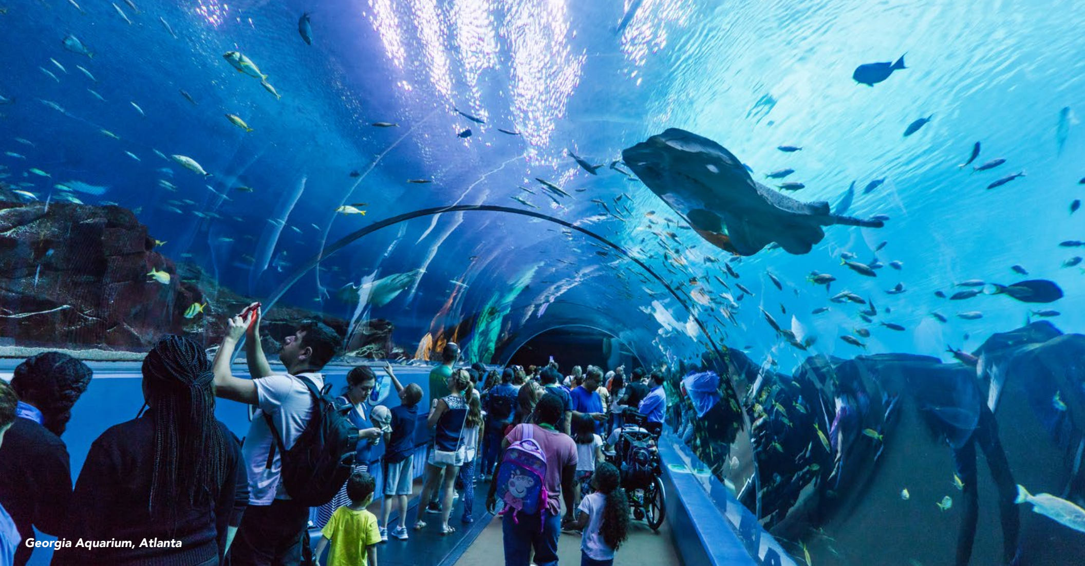
Georgia Aquarium, Atlanta