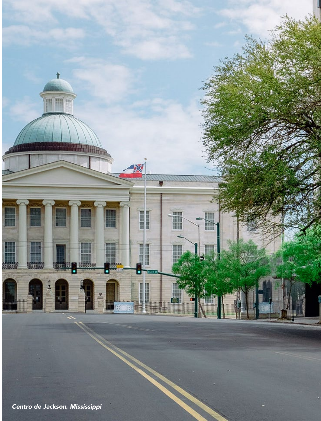
Centro de Jackson, Mississippi