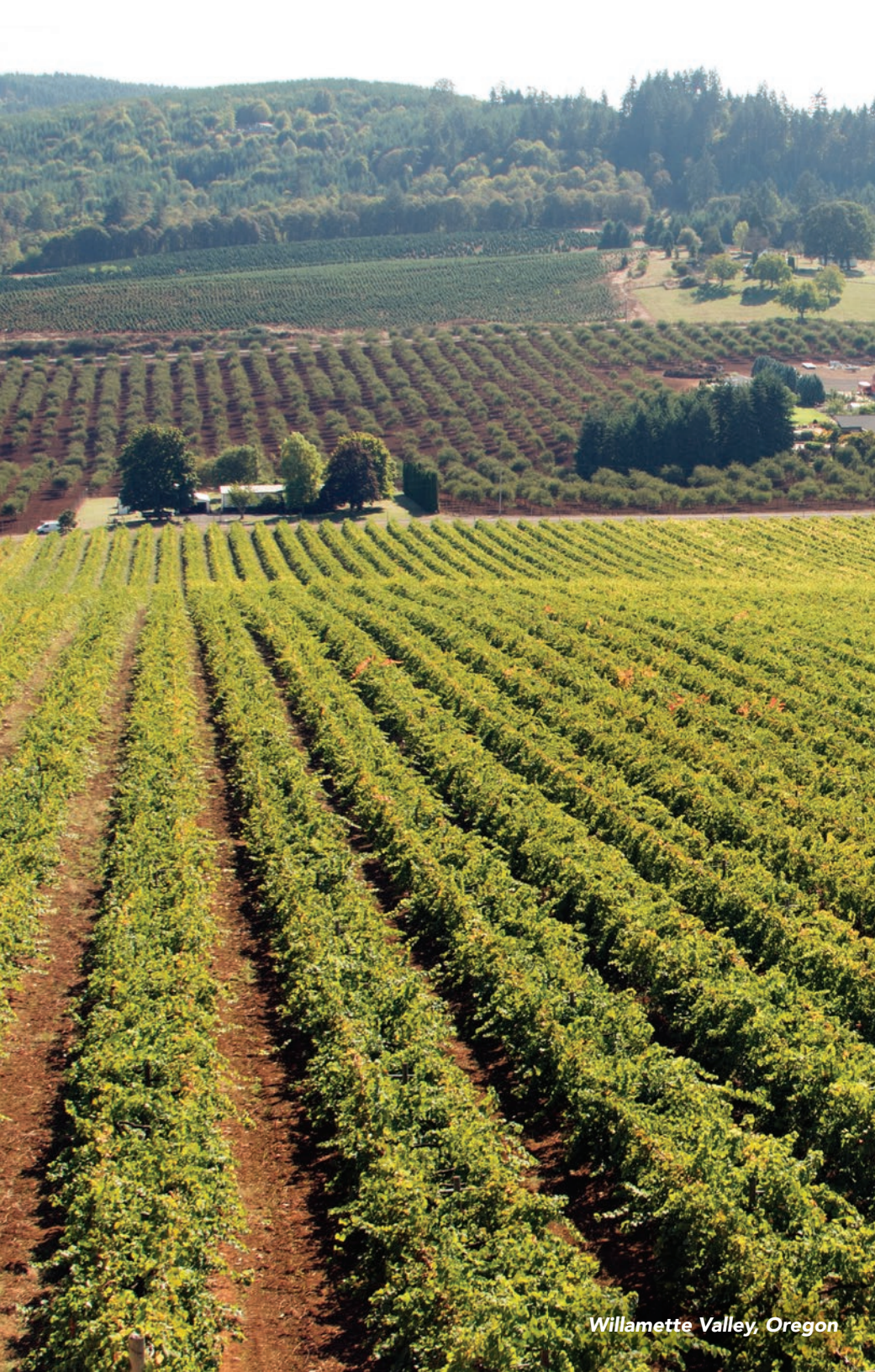
Willamette Valley, Oregon