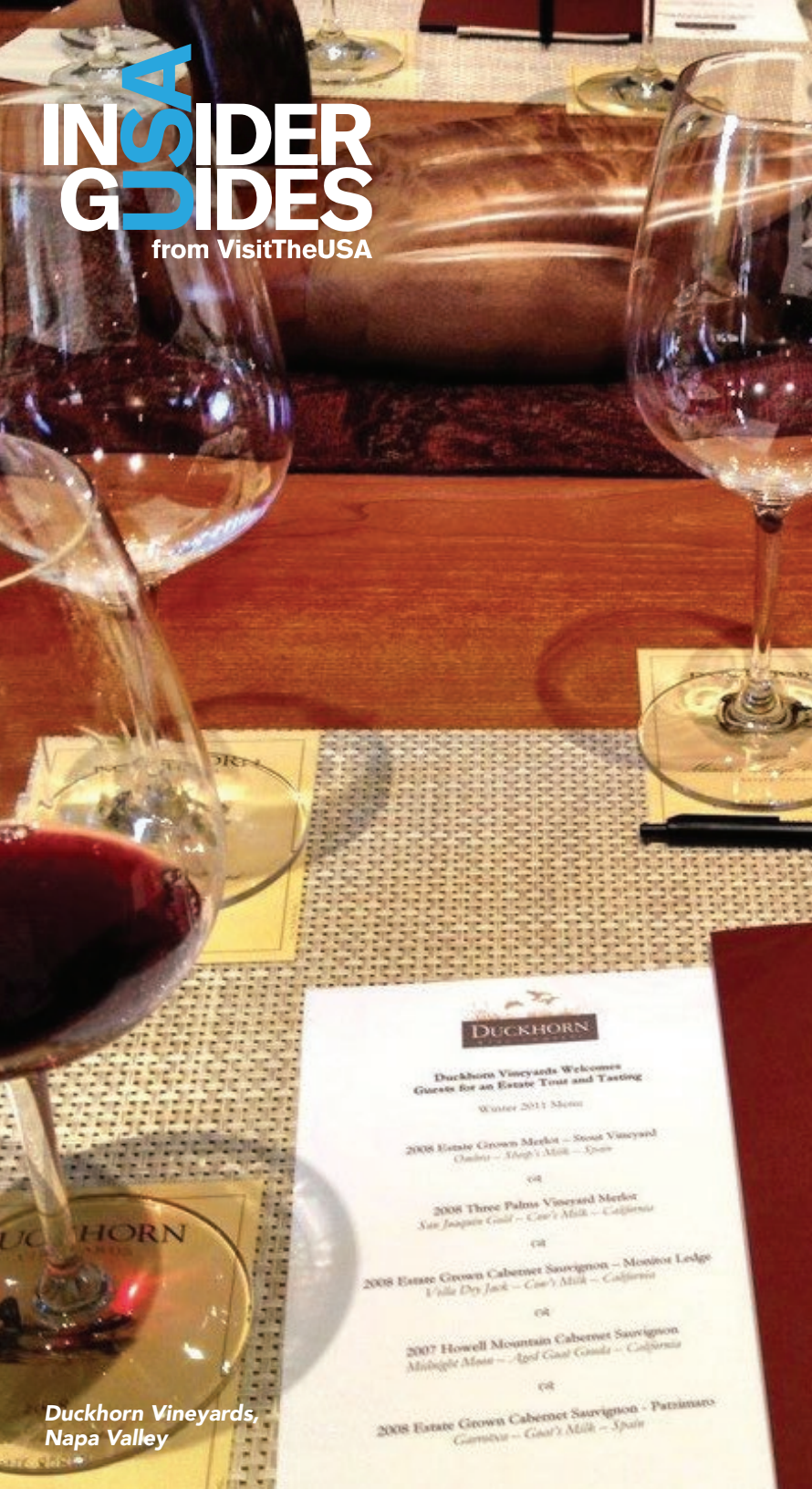
Duckhorn Vineyards, Napa Valley