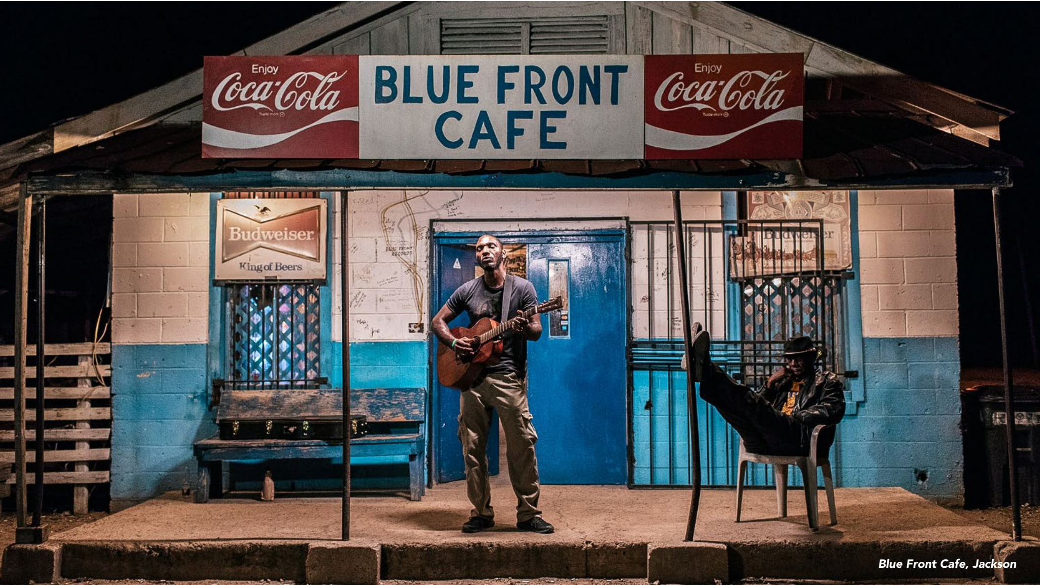
Blue Front Cafe, Jackson