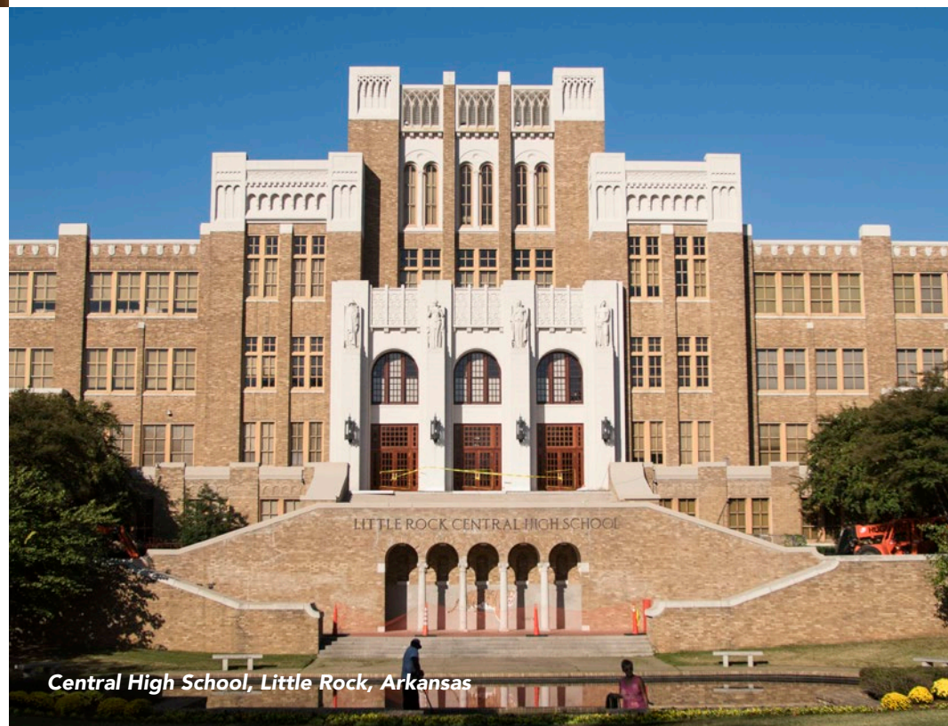
Central High School, Little Rock, Arkansas