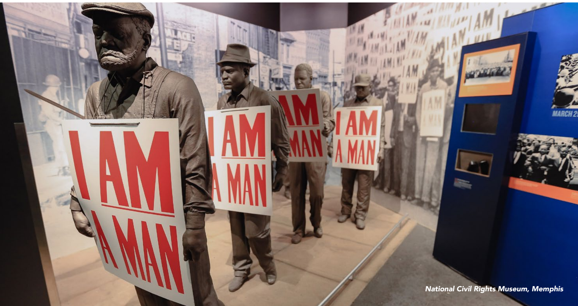
National Civil Rights Museum, Memphis