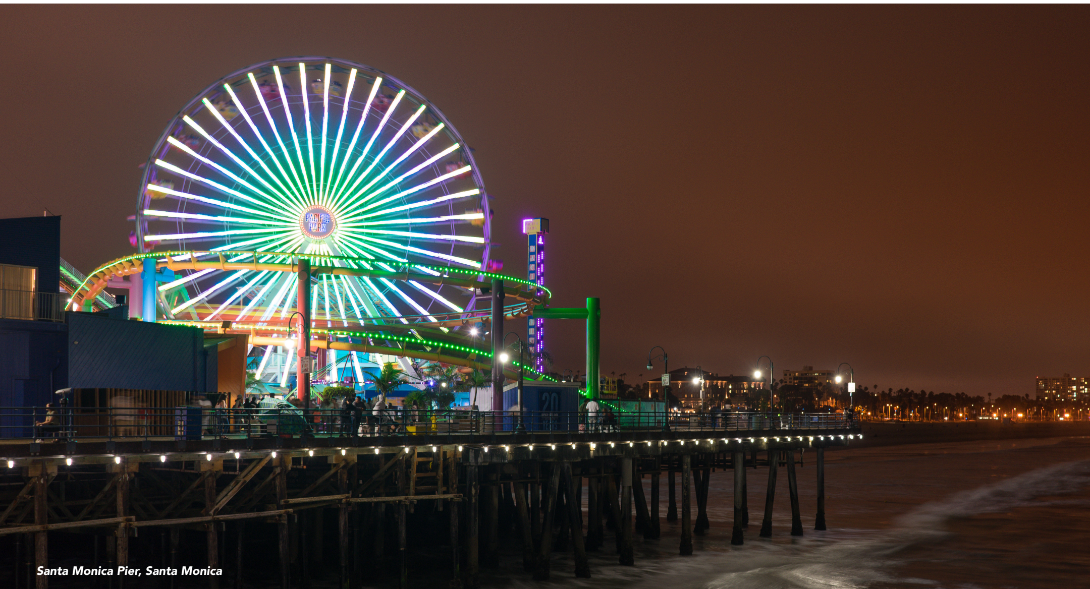
Santa Monica Pier, Santa Monica

Para buscar mais inspiração e ideias para viagens pelos EUA, acesse: VisitTheUSA.com