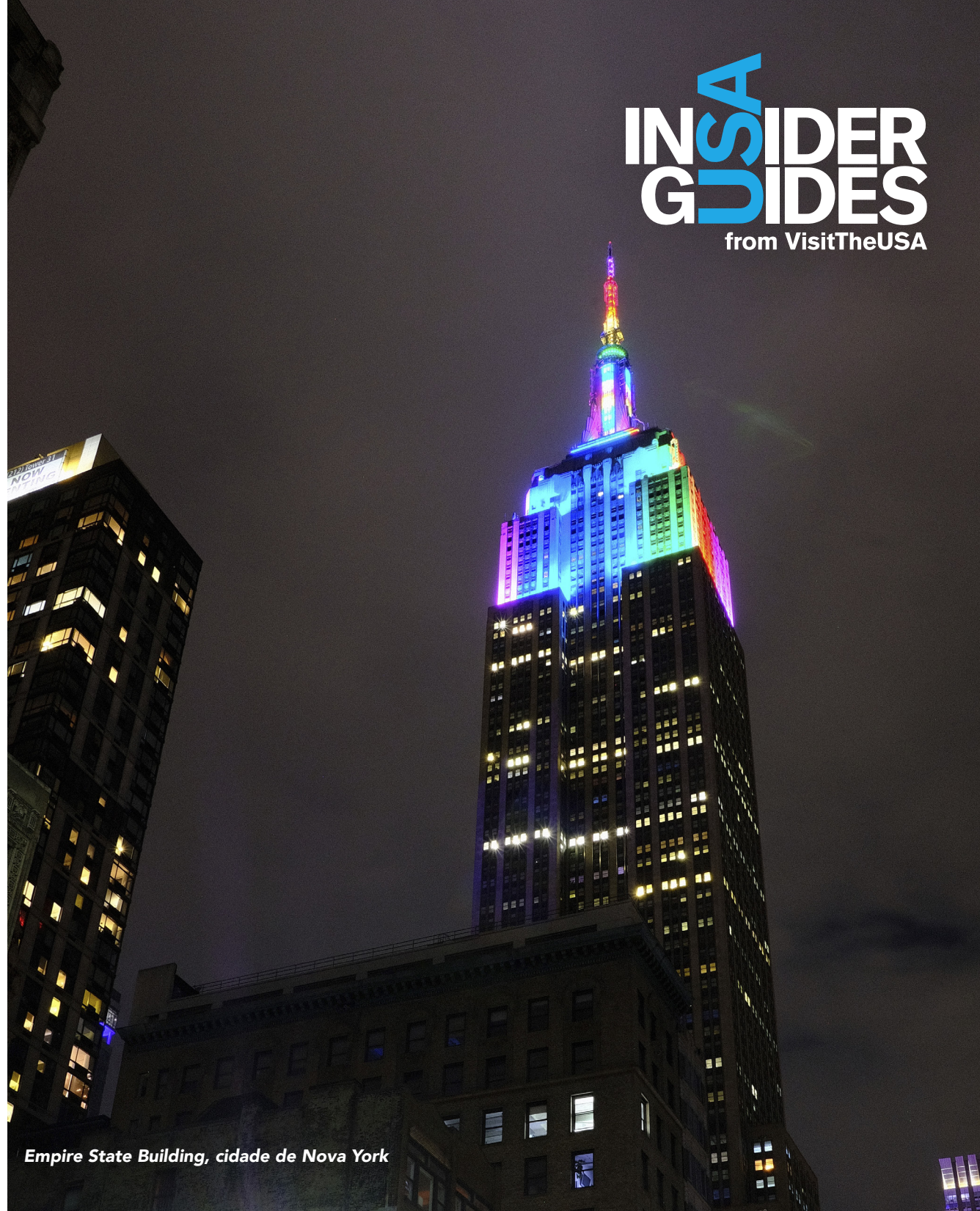
Empire State Building, cidade de Nova York