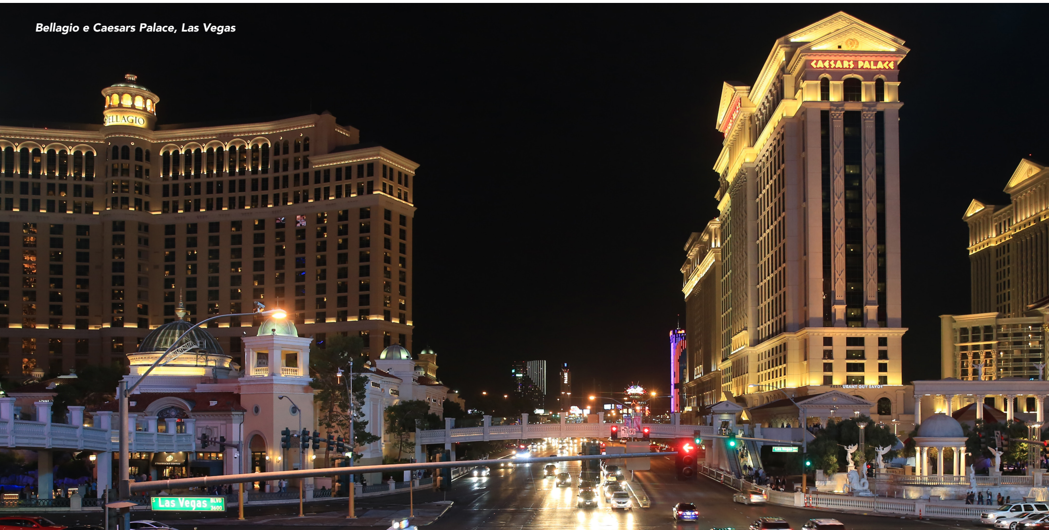
Bellagio e Caesars Palace, Las Vegas