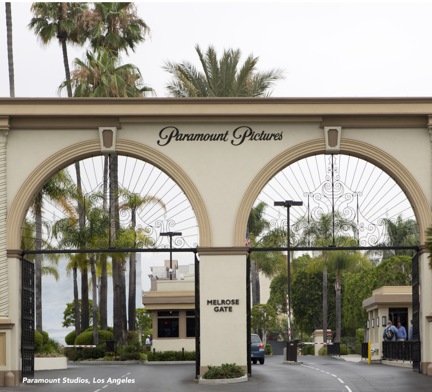
Paramount Studios, Los Angeles