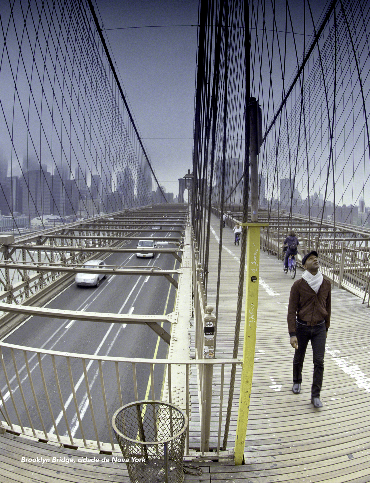
Brooklyn Bridge, cidade de Nova York